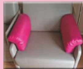
Coussins pour allaitement