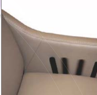
Levier freinage roues