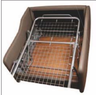
Sommier : grille acier électrosoudée suspendue