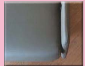
Accoudoirs fins (-6 cm sur largeur hors tout)