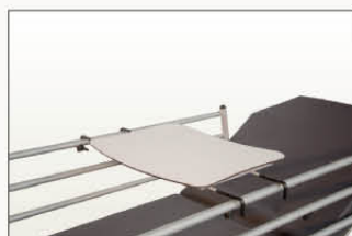
Plateau repas sur barrière