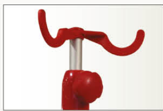
Tige porte-sérum amovible