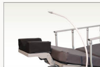
Flexible d'arrivée d'oxygène