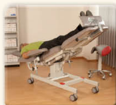
Position en déclive d'urgence activée par une pédale sur les deux côtés du fauteuil.