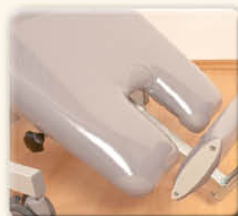
Pour s'adapter à la taille de chaque donneur le repose-pieds est réglable manuellement.