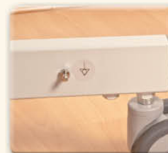
Equipotentialité sur le châssis bas pour une plus grande sécurité de vos donneurs.