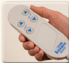
Télécommande simple pour régler la position désirée.

Avec un grand choix de couleurs unies ou deux tons votre fauteuil BasicLine peut être personnalisé à volonté.