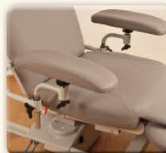
Accoudoirs transfusion sont confortables pour le bras de vos donneurs...