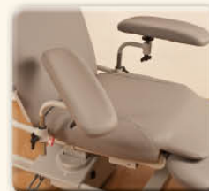
...et pouvant être ajustés horizontalement, en hauteur et en inclinaison.