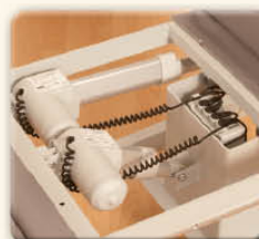
Deux moteurs directement implantés sous le siège pour un accès rapide et facile.