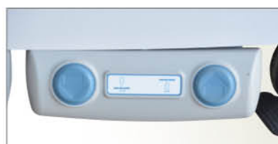
Commande Pied hauteur variable (en option).