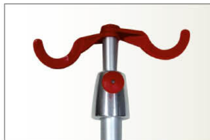
Réf TSR2 Tige porte sérum amovible