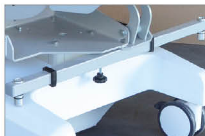
Réf FPOSA 2 emplacements pour tige à sérum