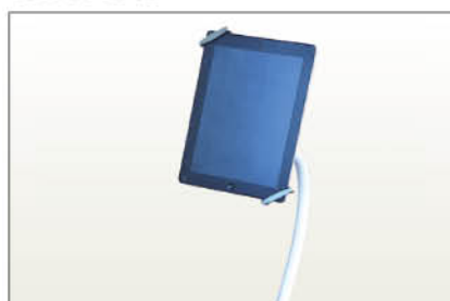
Réf SUPTAB Support I-Pad