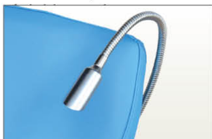
Réf FPOLAMP Lampe de lecture LED