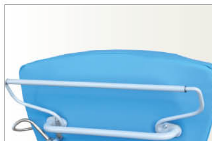
Réf FPOSR Support rouleau papier