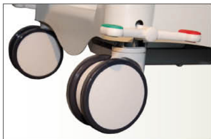
Réf FPORS2 Roue double galets Ø 150 mm