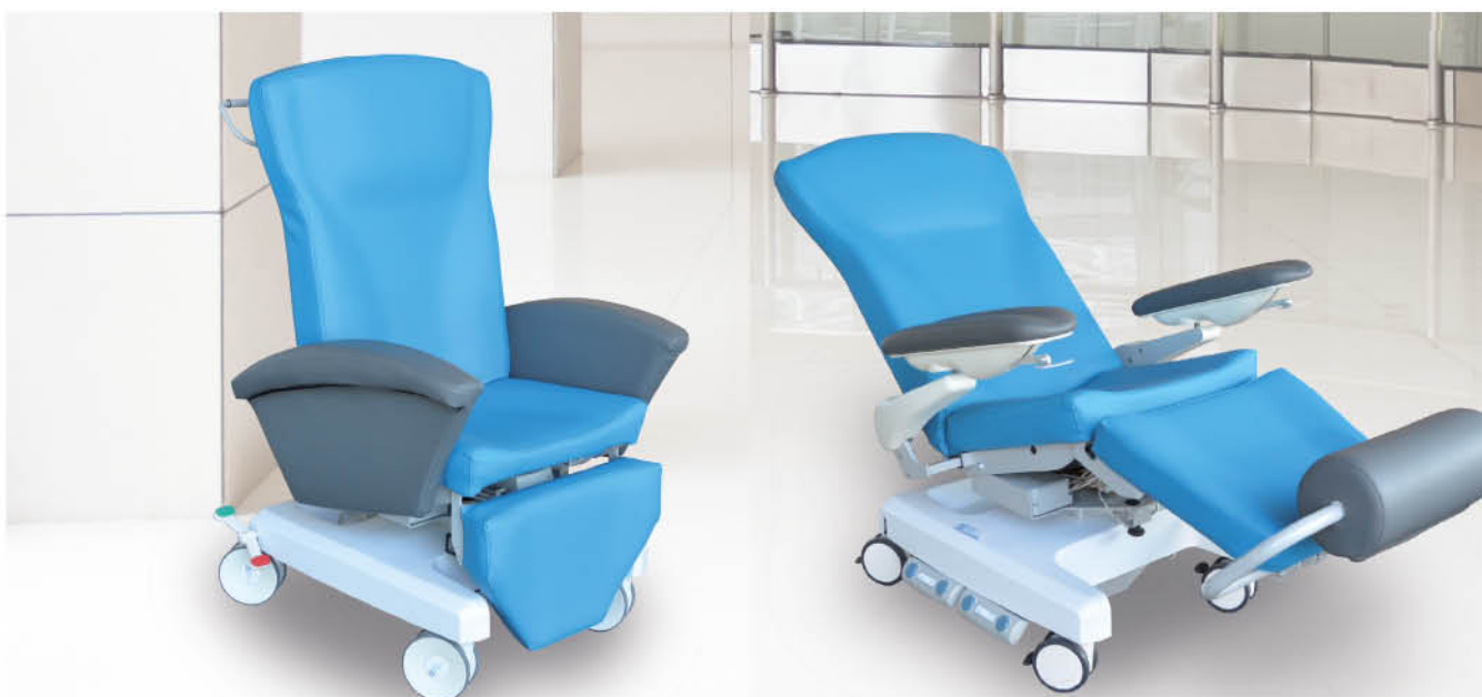
Carexia FPVE Fauteuil de soins polyvalent à hauteur variable électrique