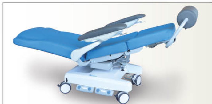
Carexia FPVE en position décline.