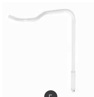
Porte-redon double réf. MID428