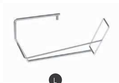
Porte-sac urine réf. MCL443