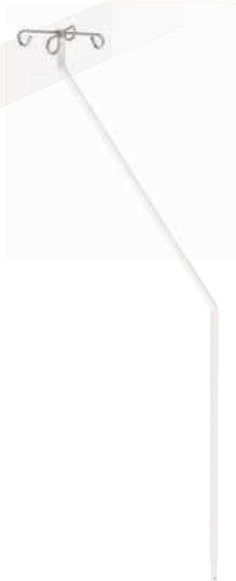
Tige porte-sérum automatique réf. MAC649