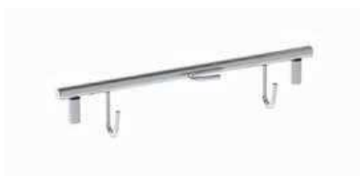
Poignée de préhension réf. MJD924