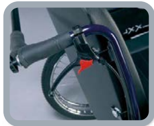
B74 - Freins à tambour