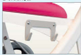
Réf PSU Crochets porte sac