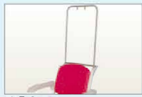
Réf TROAA Arceau antiviol