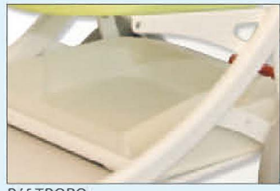
Réf TROPO Panier à effets