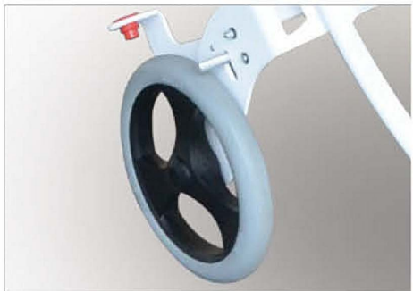
Detail roue arrière Ø 300 avec frein centralisé