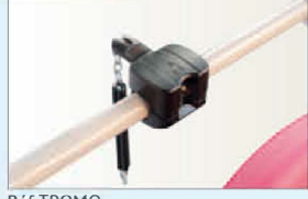
Réf TROMO Monnayeur