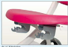
Réf TROPE Pré-équipement pour repose jambes