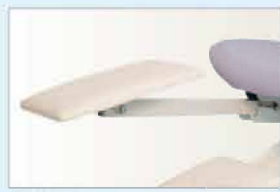
Réf TRORJ Repose jambes réglable