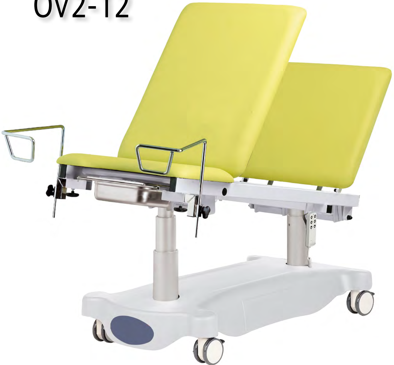
Photo avec l'option roulettes RL-125