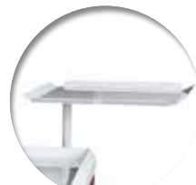
Porte-défibrillateur Porte-défibrillateur rotatif Réf : 204004