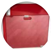
Planche massage cardiaque planche située à l'arrière du chariot Réf : 204055

Il se compose d'un plateau à bord relevé NON TACHANT, deux rails porte-accessoires avec BUTEES ANTI-CHUTE, un bâti ALUMINIUM, un socle pare-chocs PLEIN ET RESISTANT, 4 roues pivotantes de diamètre 12,5 cm dont 2 à frein multidirectionnel. Accès intérieur complet pour le nettoyage, avec démontage des parois sans outil.