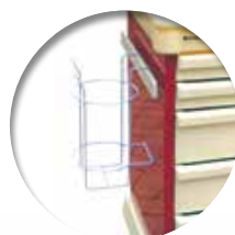
Support-obus Support-obus oxygène Réf : 204025