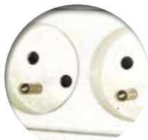
Bloc 5 prises Bloc électrique avec interrupteur Réf : 204066