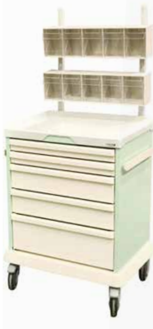
Chariot d'anesthésie Réf : 205000 + 204005