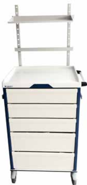
Chariot d'anesthésie Réf : 205050 + 204000