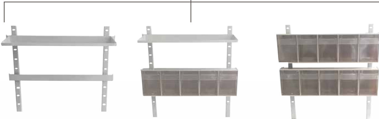
Portique 2 rails Réf : 204010 + Étagère Réf : 204001

Rail supplémentaire pour portique : Réf. 204018