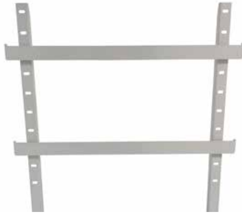
Portique 2 rails Réf : 204010