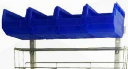
Boîte à bec x4 Réf : 204014