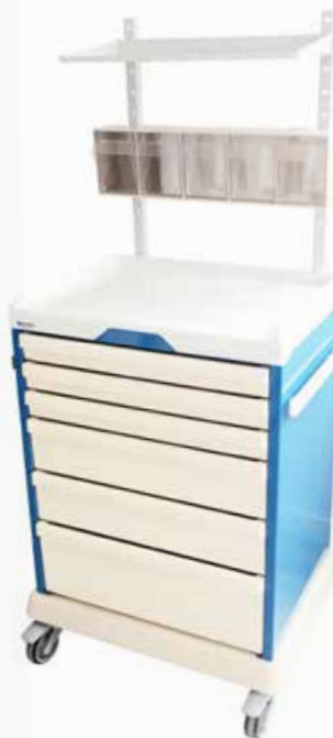
Chariot d'anesthésie Réf : 205020 + 204006