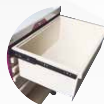
Grand tiroir sur rails télescopiques Réf : 401035