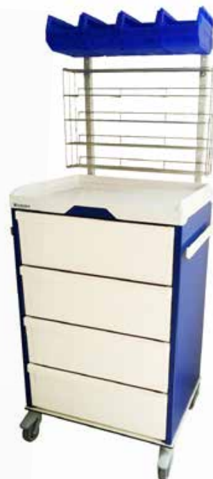
Chariot d'anesthésie Réf : 205050 + 204013