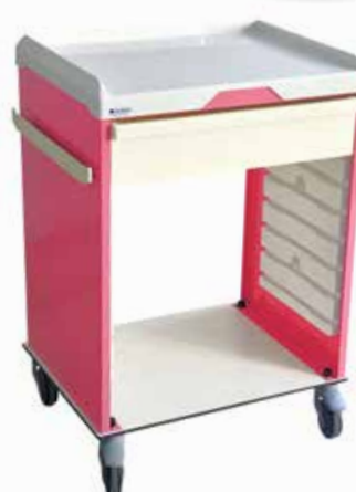
Chariot de service avec tiroir Réf : 203038 + 401020