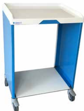
Chariot de service Réf : 203037