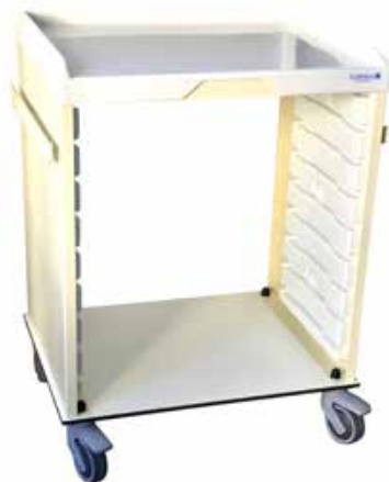
Chariot de service avec 9 glissières Réf : 203038