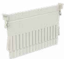
Croisillon Long Réf : 401038 Croisillon Large Réf : 401039