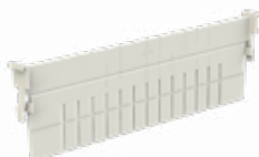
Croisillon Long Réf : 401028 Croisillon Large Réf : 401029