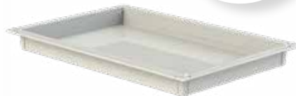
Petit panier 60 x 40 x 5 cm Réf : 401017