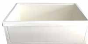
Grand tiroir 600 x 400 x 205 mm Réf : 401030 Encombrement : 3 glissières

Tiroirs à façade jointive qui protègent leur contenu de la poussière et de la lumière. Ils sont munis de butées d'arrêt en fin de course pour prévenir toute chute à l'ouverture, et d'une cornière à l'arrière pour l'accrochage sur rails muraux normalisés.