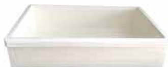
Moyen tiroir 600 x 400 x 135 mm Réf : 401020 Encombrement : 2 glissières