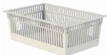
Grand panier 60 x 40 x 20 cm Réf : 401037