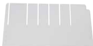
Croisillon Long Réf : 406062 Croisillon Large Réf : 407063