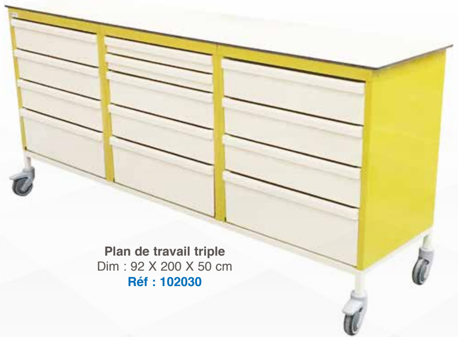
Plan de travail triple Dim : 92 X 200 X 50 cm Réf : 102030