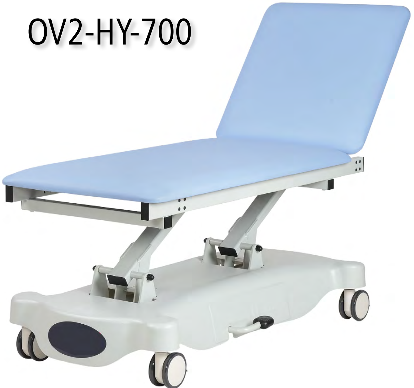
photo du modèle avec roulettes RL125 en option