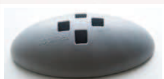
Pied stabilisateur pour paravent léger RLP