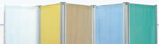
Choix des coloris possible par battant

Paravent léger disponible en Trevira®CS en option.