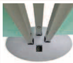
3 RLP par pied