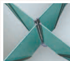
4 RLP par pied