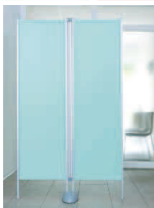
RLP/2 utilisé avec RLP/C