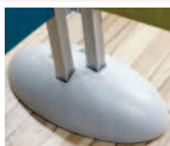
2 RLP par pied