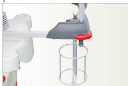
Ref CROS02 Support obus vertical