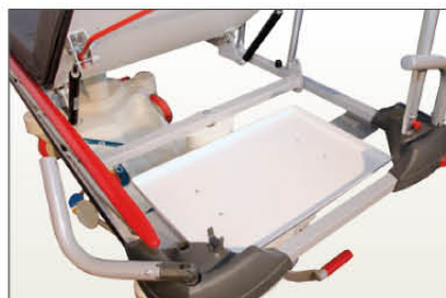
Ref CRODOC Support dossier sous tête