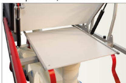
Ref CROK7 Support cassette radio sous le plan de couchage