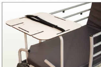
Réf CROPSC Plateau support scope au pied du malade