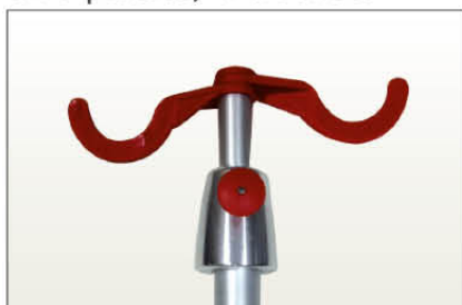
Réf TSR2 Tige porte sérum « confort », en 3 parties, 2 crochets