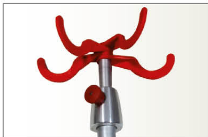
Réf TSE4C Tige porte sérum « confort », en 3 parties, 4 crochets