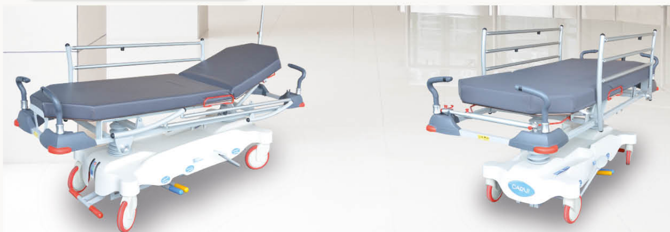
CARVI 60 - 70 - 80 Chariot brancard à hauteur variable sur colonnes hydrauliques

CARVI est un chariot brancard à hauteur variable sur colonnes hydrauliques.