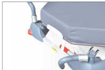
Réf CROBPT Barres de poussée escamotables côté tête