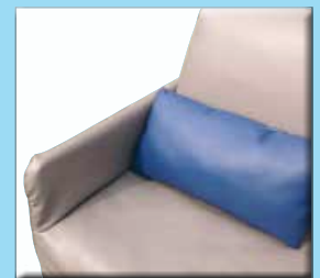
Coussin de confort