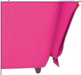
4 roulettes dont 2 à freins pour faciliter le nettoyage