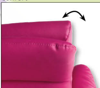
Coussin repose tête réglable