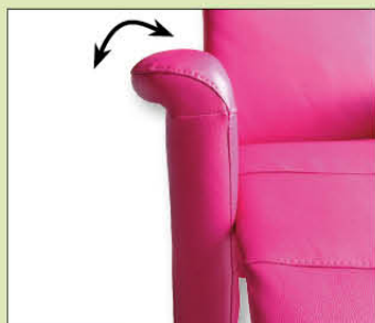
Accoudoirs réglables en inclinaison