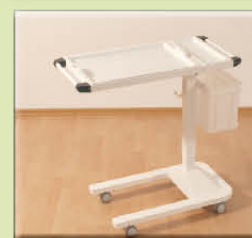
Tablette repas / lecture réglable et mobile