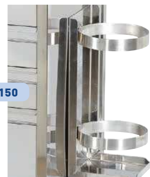
SUPPORT OBUS INOX