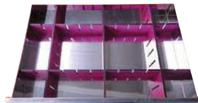
SÉPARATEURS TIROIRS résine