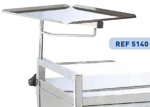
SUPPORT MONITORING avec étau