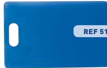
PLAQUE MASSAGE CARDIAQUE