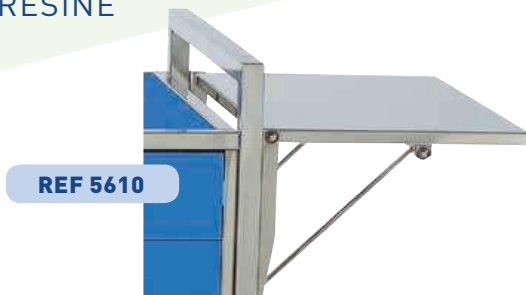
TABLETTE ESCAMOTABLE INOX ou RÉSINE