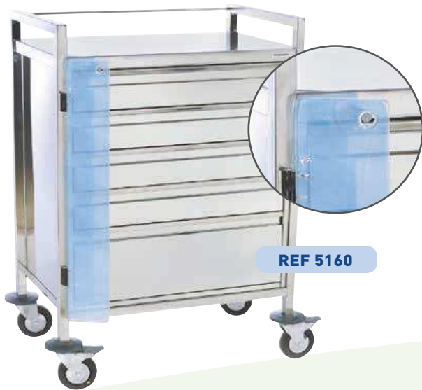
FERMETURE CENTRALISÉE PAR PLOMB OU CADENAS