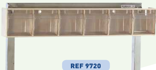
Tiroirs basculants 6 tiroirs