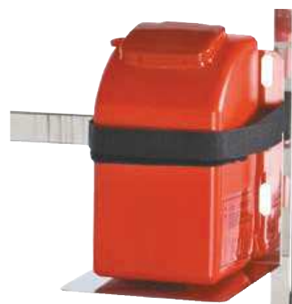
Support container à aiguilles réglable (sans container)