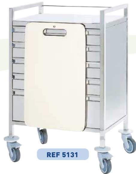
FERMETURE CENTRALISÉE PAR PLAQUE DE MASSAGE CARDIAQUE