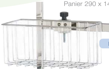
Panier 290 x 140 x 145 mm