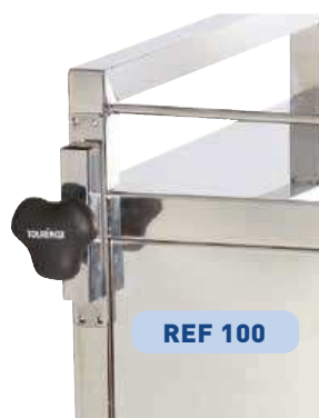
ÉTAUX SUR CHARIOT