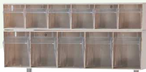
Tiroirs basculants 11 tiroirs