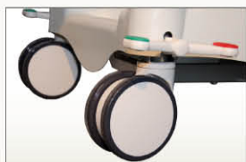
Roulettes double galets diamètre 150 mm