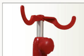
Tige porte-sérum amovible