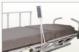
Flexible support télécommande