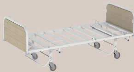
Piètement métal avec roulettes, freinage par barres de blocage ou pédales bilatérales