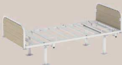
Piètement métal simple avec patins ou avec platines de fixation au sol