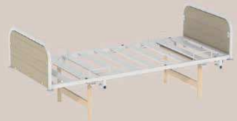
Piètement bois massif