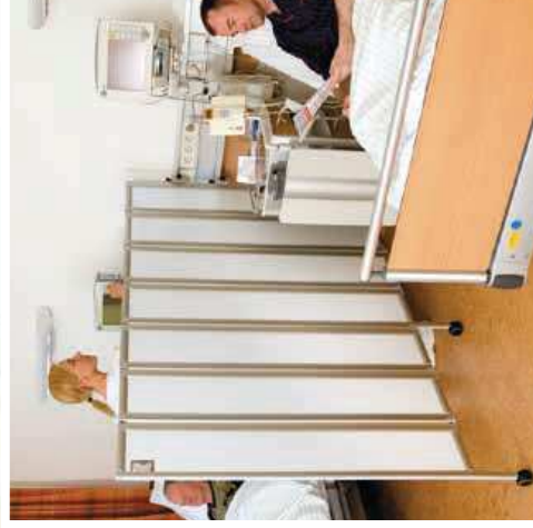
Montage sur rail

Il est possible de rendre le paravent rigide encore plus moderne en ajoutant sur les battants un design ou couleur de votre choix.