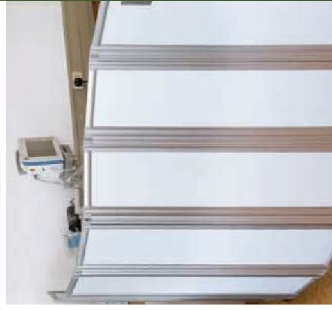
Les charnières à 360° permettent de le positionner comme vous le souhaitez.