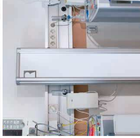
Replié de face ou de côté le paravent rigide est un réel gain de place.