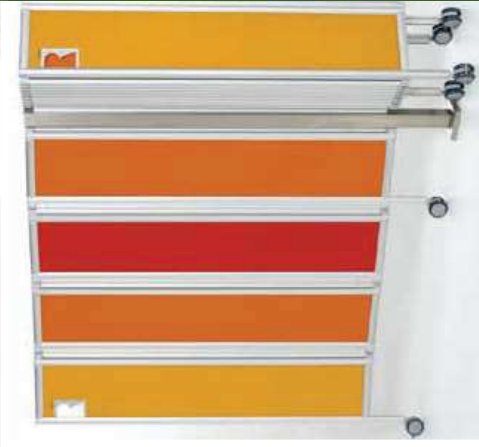
Montage sur colonne