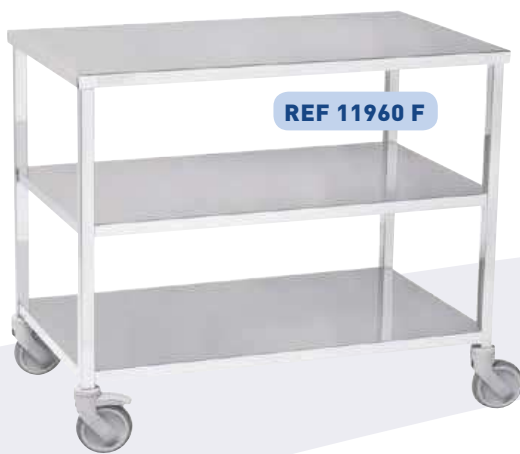
REF 11960 F