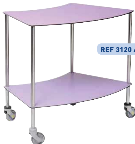
REF 3120 A