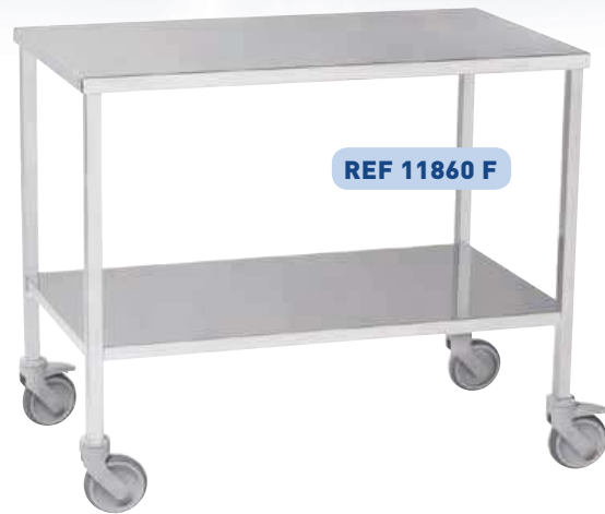
REF 11860 F