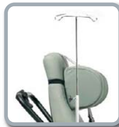
Option B52 Porte sérum

Repose-jambes à allongement automatique indépendant