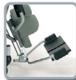
Option palettes séparées (sur demande à la commande)

Coussin anti-escarre disponible en option. (T2, T11, T14)