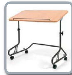
Table 378 disponible