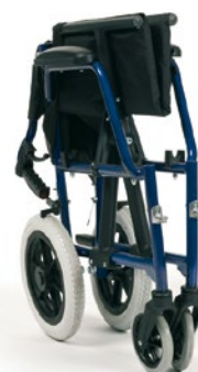
Pliable pour un transport facile