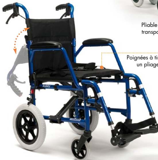
Poignées à tirer pour un pliage rapide