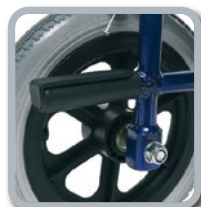
Pédale inférieure pour incliner le fauteuil