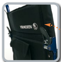
Dossier pliant avec pochette de rangement

Que ce soit en voyage, à l'hôpital ou dans un aéroport, pour un transfert d'un point A à un point B, le fauteuil Bobby est facile à plier, entreposer, et demande peu d'entretien.