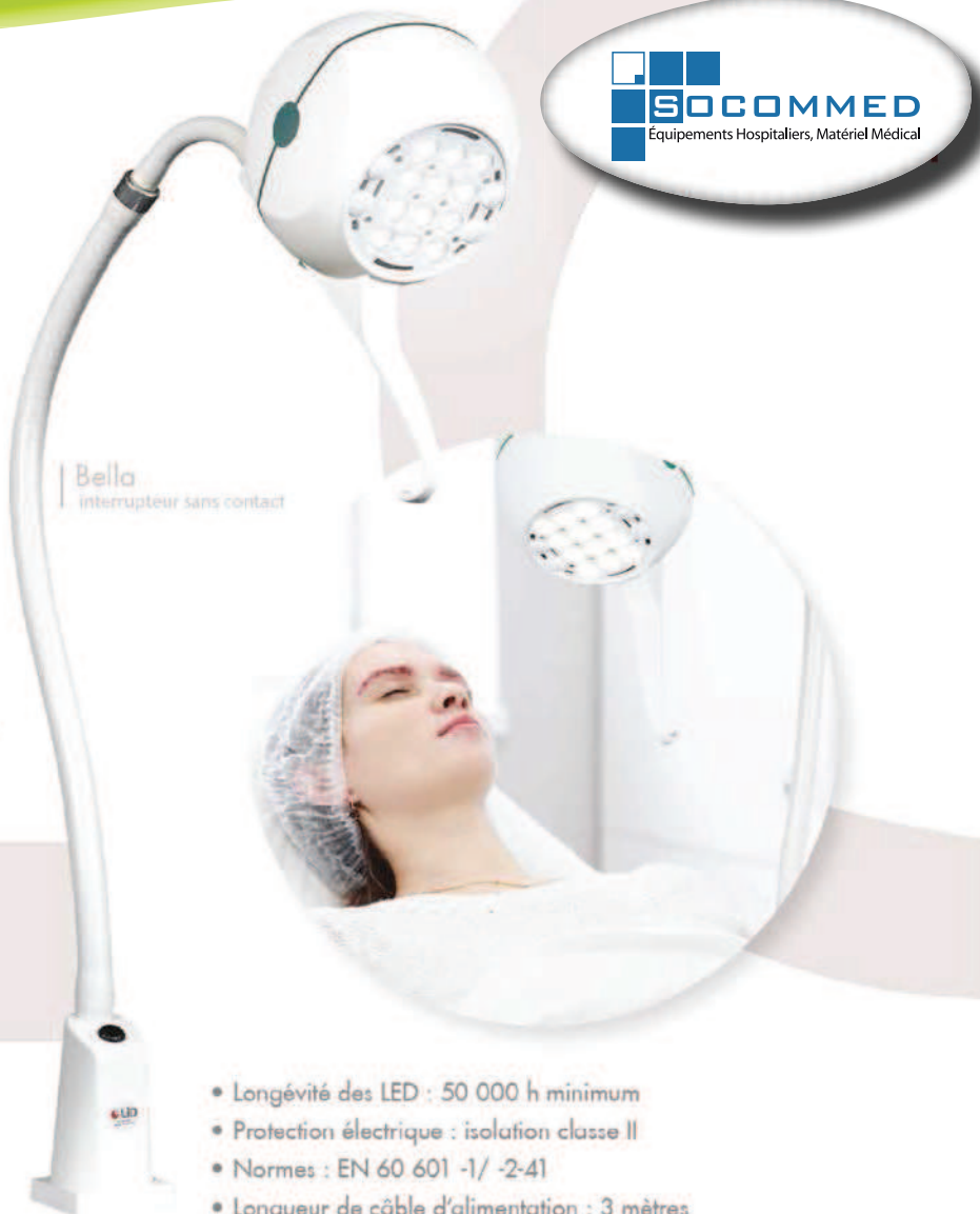
Bella interrupteur sans contact

Idéale en chirurgie mineure, en dermatologie et chirurgie esthétique