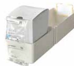
Bac nominatif seul Réf. 402070