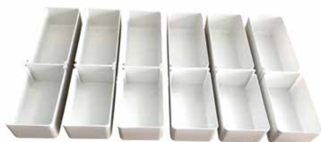
Aménagement d'un tiroir avec 6 bacs pour 6 résidents Kit 6 résidents Réf. 402075