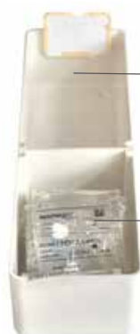
Stock hors pilulier